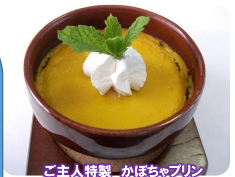
ご主人特製 かぼちゃプリン

いや～、楽しいですね。生活リズムに慣れていないのもあり気疲れはしますが、今は何をやっても楽しいです。実は、何人ものお客さんから「冷やしラーメン」を作ってくれと要望があって、最近冷やしラーメンだけ始めたんですよ。そしたら「やはりマスターの冷やしラーメンは最高だな」と言ってくれ、そのあと「冷やしの季節が終わったら温かいラーメンを頼むよ」と言われたのだけど、「そば屋は引退したのだからやらないよ」と答えました(笑) 私が担当しているのはカレーとかぼちゃプリンですが、ぜったい旨いと思って作っているんですよ。 今までに無いジャンルのものを作るのはとても面白いし、これからも様々なメニューに挑戦して、美味しいデザートを届けられたらいいなと思っていますところですよ。