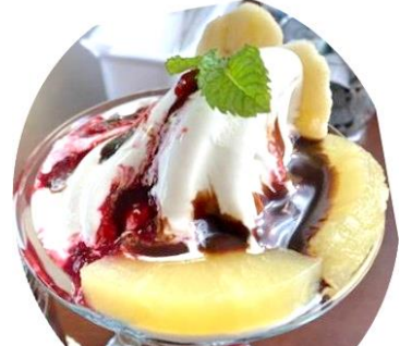
男性からの注文が多いというチョコレートパフェ