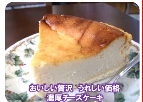
おいしい贅沢 うれしい価格 濃厚チーズケーキ

東部食堂では、「ありがとうございます」ではなく、いつも「おしょうしな〜」と言ってました。この歳になってお店を出せるのは感謝の気持ちしかありませんから、感謝の気持ちが一番伝わる言葉をお店の名前にしたいなと思いました。であれば「おしょうしな」を店舗名にするのが一番しっくりすると思い、この名前にしました。おしょうしなの前に「来っ茶。」(←きっちゃてん)としたのは、私が「小さな喫茶店」を「小さなきっちゃてん♪」と口癖のように歌っていたところから、それをお店の名前にあてがいました(笑)