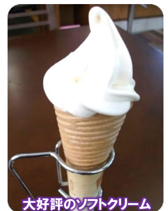
大好評のソフトクリーム

チーズケーキを250円でお出ししていますが、先日お召し上がりいただいたお客様が、すごく美味しく家族に食べさせたいからワンホール欲しいと言われご提供しました。ケーキもサラダのドレッシングもすべて私の手作りですから、美味しいと褒められるととっても嬉しいです。これからも研究を重ね、より良い商品をお出ししたいと思っています。